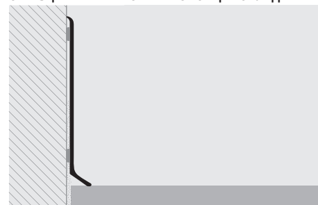
ОБРАЗЦЫ И ТЕХНИЧЕСКИЕ ИНСТРУКЦИИ УКЛАДКИ

ПО ЗАПРОСУ ПРОИЗВОДИТСЯ В ДРУГИХ ОТДЕЛКАХ ИЗ НАШЕЙ ГАММЫ. ОБРАТИТЕСЬ К НАШЕМУ ОТДЕЛУ ЭКСПОРТА ПО ВОПРОСУ О МИНИМАЛЬНОМ КОЛИЧЕСТВЕ, О СРОКЕ ПРОИЗВОДСТВА И ЦЕНАХ